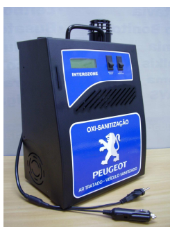
Máquina de oxo-sanitização

A utilização/aplicação é muito simples, basta solicitar inteiramente grátis a máquina de oxo-sanitização e adquirir o cartão que ativa o equipamento, comprando normalmente como uma peça de reposição ou acessório através da referência: LBRP005253.